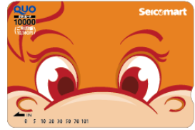
セイコーマート店頭限定デザイン QUO カード(一例)

https://www.quocard.com/product/shop-original/seicomart/