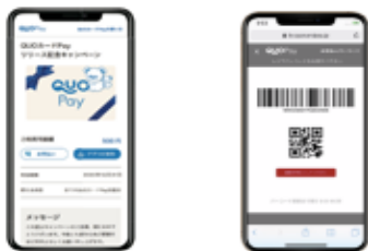
スマホ画面表示イメージ