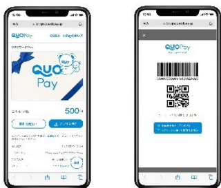
スマホ画面表示イメージ