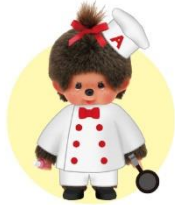
第2回 モンチッチちゃん