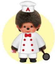
第1回 モンチッチくん