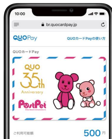
スマホ画面表示イメージ

当社は、1987年の創立以降、プリペイドカード「QUOカード」の発行を通じて平成の時代と共に成長し、令和時代に入ってから人と会社、人とビジネス、人と社会といった様々なステークホルダーを“つなぐ”という価値を創造し続けてきました。