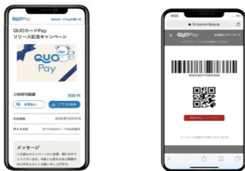
スマホ画面表示イメージ