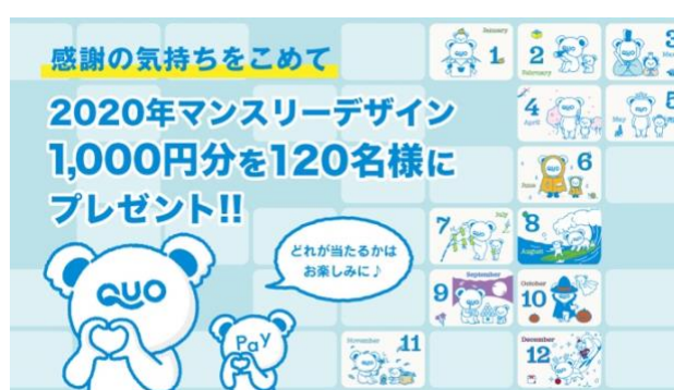
第4弾「2020年マンスリーデザイン QUO カード Pay プレゼントキャンペーン」