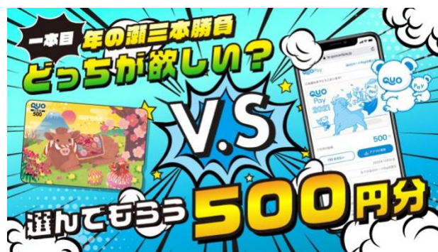
第2弾「QUO カード vs QUO カード Pay リベンジマッチ！年の瀬三本勝負キャンペーン」