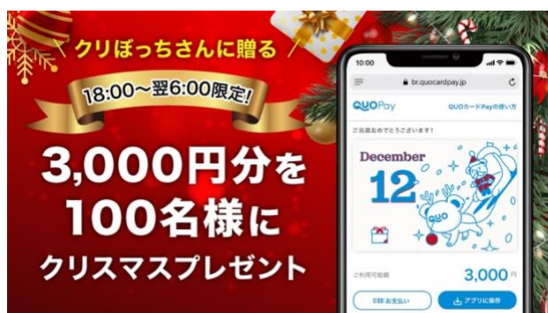
第1弾「クオとペイからクリスマスプレゼント！キャンペーン」

全国共通のプリペイドカード「QUOカード」を発行している株式会社クオカード(以下当社、本社：東京都中央区、代表取締役社長：近田 剛)が展開するスマートフォンで使えるデジタルギフト『QUOカードPay(クオ・カード ペイ)』は、2020年12月24日(木)～2021年1月10日(日)の期間中、総額約150万円分のQUOカードPayが抽選で30,520名※に当たる4種のTwitterキャンペーンを実施します。※総額「約150万円分」と当選者数合計「30,520名」にはキャンペーン第2弾「QUOカード vs QUOカードPay! リベンジマッチ！年の瀬三本勝負」キャンペーンのQUOカードの当選金額と当選者数は含まれていません。