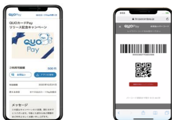
スマホ画面表示イメージ