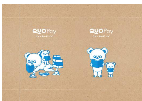
キャンペーン限定ブックカバー

またキャンペーン実施店舗では、QUOカードPay公式キャラクターの「クオとペイ」が読書をしているデザインの限定ブックカバーとしおりも配布します。