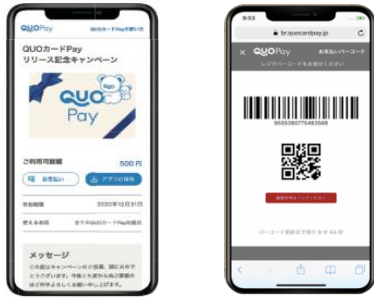
スマホ画面表示イメージ