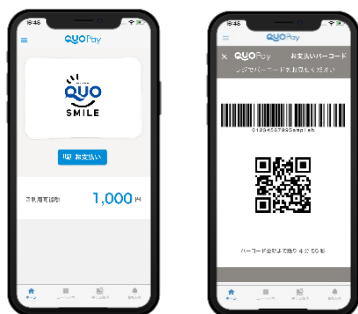
スマホ画面表示イメージ ※画像は開発中のものです。