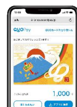
スマホ画面表示イメージ