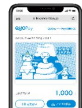
スマホ画面表示イメージ