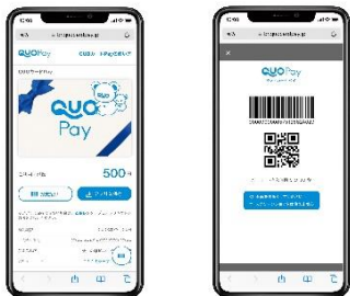
スマホ画面表示イメージ