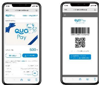
スマホ画面表示イメージ