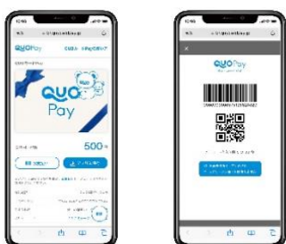
スマホ画面表示イメージ