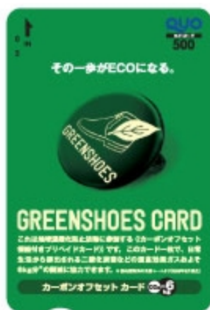
そのまま贈れる スタンダードカード