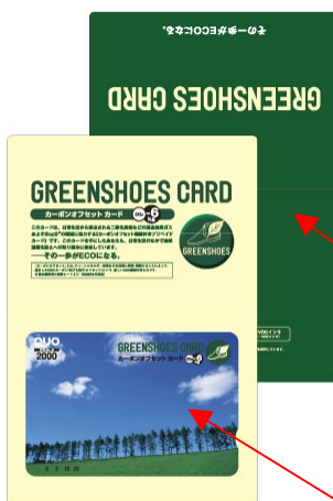
自由にデザインできる オリジナルカード